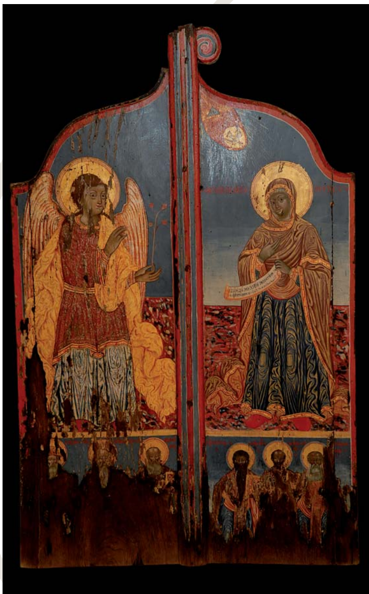
Βημόθυρα του 19 ου αιώνα με παράσταση του Ευαγγελισμού της Θεοτόκου επάνω και κάτω απεικονίσεις έξι Αγίων, μοναχών και ιεραρχών.